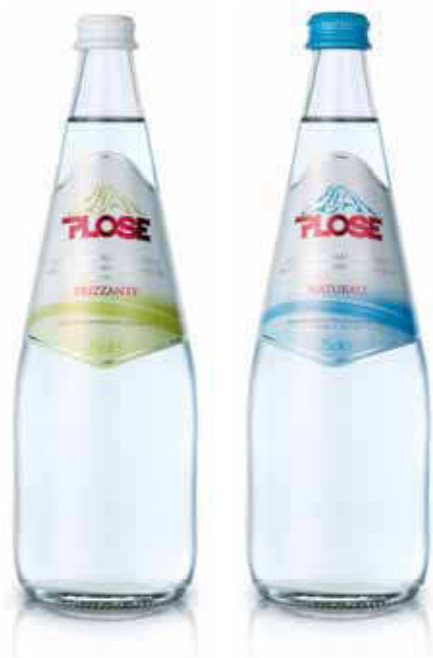
Acqua min Naturale VAR CI 75 Acqua min Frizzante VAR CI 75